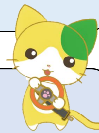
佐賀県交通安全キャラクター マニャー